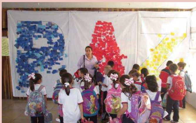
La murale pour la paix réalisée par les élèves du Collège Miguel de Bolonia