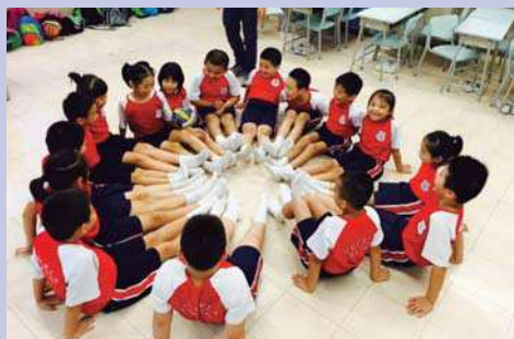
Des enfants assis en cercle, la photo gagnante du concours

À l'école De La Salle St Helen's, en Angleterre, les élèves ont créé une grande exposition sur le thème de la crise des migrants et des réfugiés.