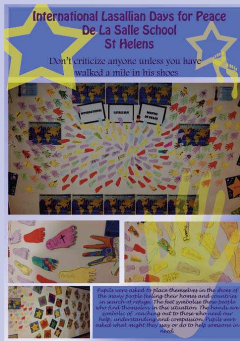
La mosaïque réalisée par les élèves de De La Salle St Helen's