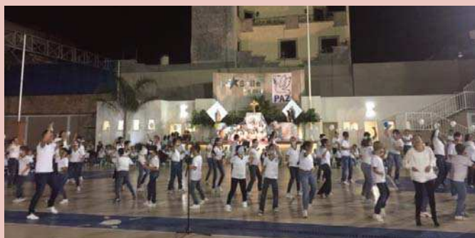
La cérémonie de clôture au Collège Miguel de Bolonia