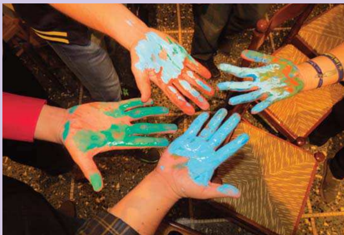
Un moment de solidarité et de communion lors du 3 e Symposium International des Jeunes Lasalliens, en février 2014

Le réseautage et les communications sont interconnectés. Le réseautage, c'est faire la promotion du besoin et des bénéfices liés au partage et à avoir des relations avec les autres, alors qu'améliorer les communications signifie développer les moyens afin de rendre ce réseautage possible.