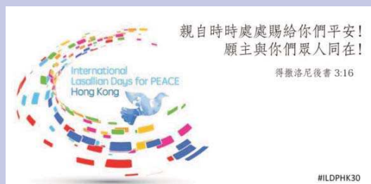
La photo de profil de la page Facebook

Le titre du projet, « Ne critiquez personne à moins que vous n'ayez marché un kilomètre avec ses souliers », illustre bien l'intention. Les élèves ont été invités à se mettre à la place des réfugiés afin de mieux comprendre leur situation, puis à penser à ce qu'ils pourraient faire pour aider ceux qui sont dans le besoin. Sur la mosaïque, les pieds représentent ceux des réfugiés, tandis que les mains sont celles qui doivent leur être tendues. Un bel exemple d'une réponse aux problèmes urgents de notre temps!