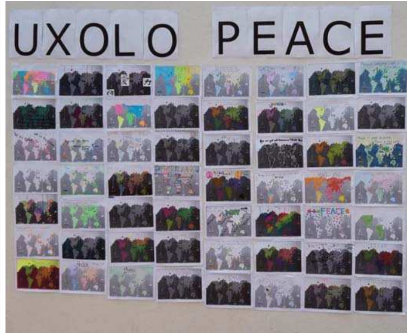
Un aperçu du résultat final du mur de la paix