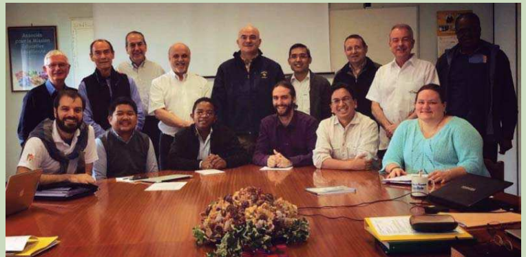
Le Conseil Général entourant le Conseil International des Jeunes Lasalliens lors de sa dernière réunion en février 2015

Notre objectif est de contribuer aux procédés qui permettent de nourrir une « culture des vocations » qui appuie les adolescents et les jeunes adultes engagés dans la mission et qui les met au défi de cheminer afin d'avoir la vie, et de l'avoir en abondance.