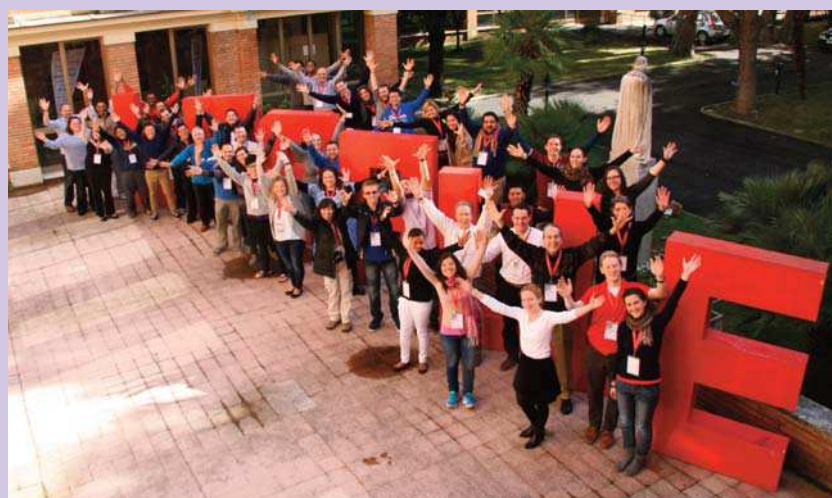
Photo de groupe lors du 3 e Symposium International des Jeunes Lasalliens, en février 2014

Notre objectif est d'encourager les procédés et les stratégies qui font la promotion d'une croissance organisationnelle durable à travers l'autosuffisance et la reddition de comptes. Cela demande d'établir des attentes claires et un engagement de la part des leaders des régions, des Districts et des Jeunes Lasalliens, lequel ne peut être dynamique et productif que grâce à un dialogue constant. Cela encourage donc également la présence de Jeunes Lasalliens dans les structures de l'Institut à tous les niveaux.