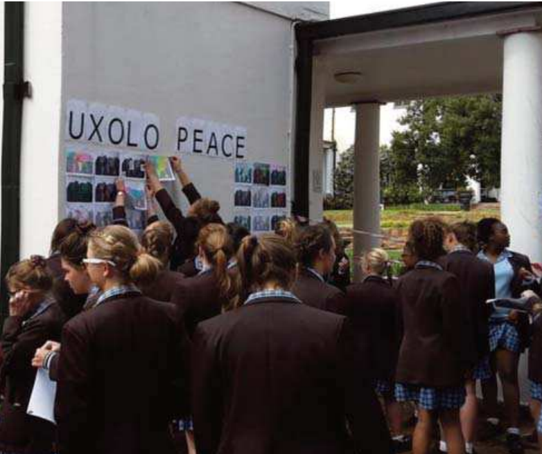
Des élèves apportant leur contribution